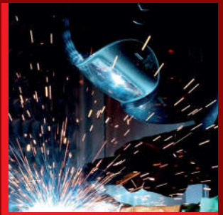
SOUDURE ACIER / INOX / ALU