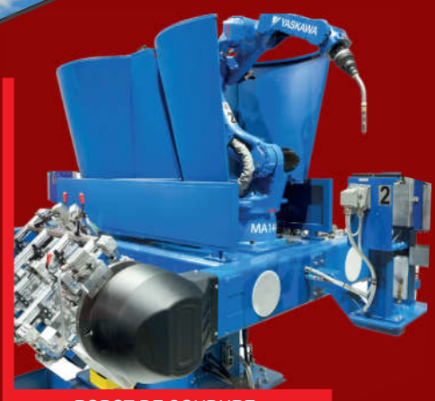
ROBOT DE SOUDURE